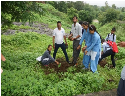
Tree Plantation at Shevage Darana