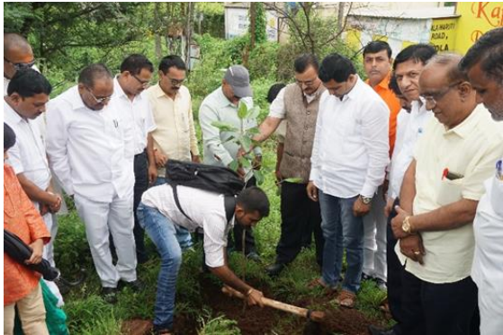
Tree Plantation at Shenit