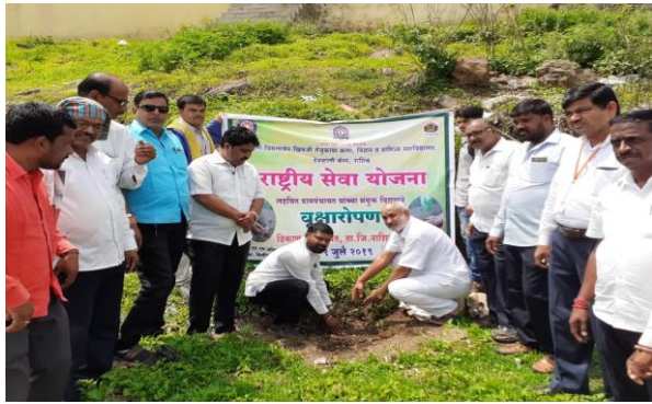
Tree Plantation at Lahavit