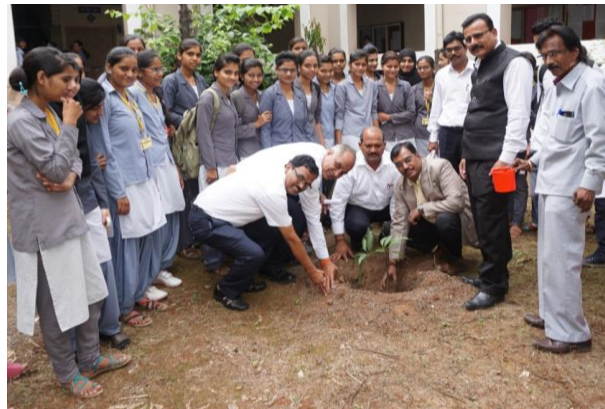
Tree Plantation on college campus on World EVS Day