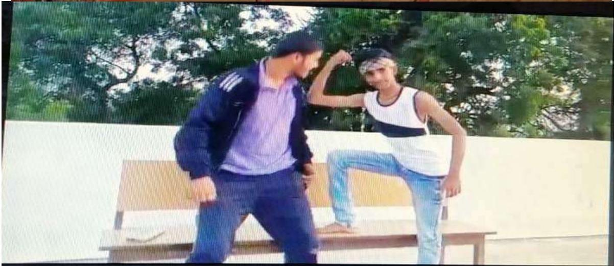
State Level Skit Competition