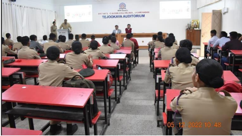
Photo plate:- Our 4 students selected as Aagniveer in Indian Army. Felicitation of selected students on 6 th Dec.2022 and they share their experience with students.