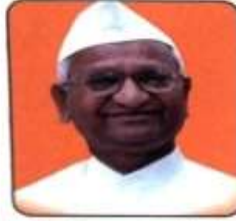
मा.डॉ. अण्णासाहेब हजारे 'पद्मभूषण' थोर समाजसेवक