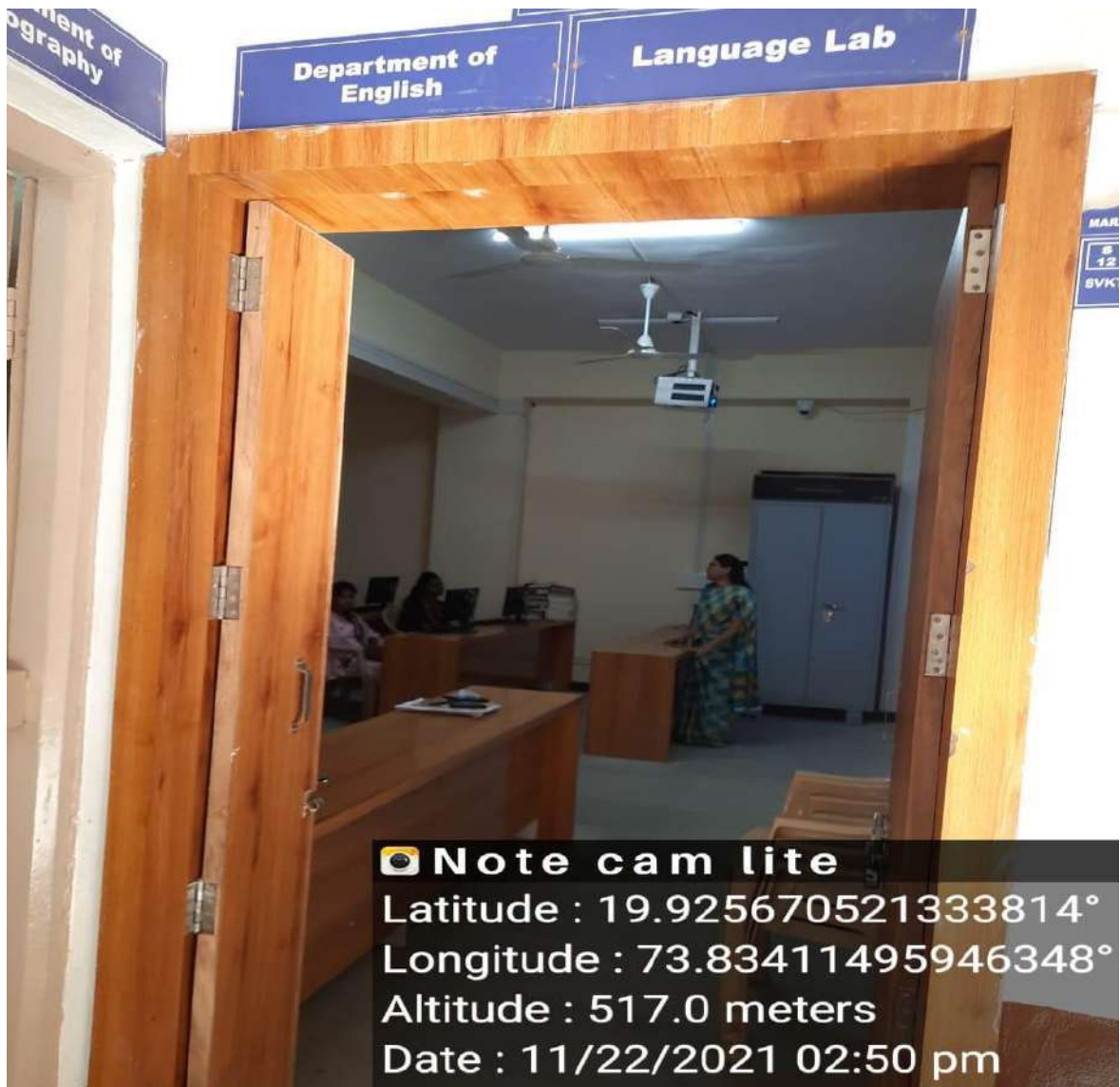
English Language Lab