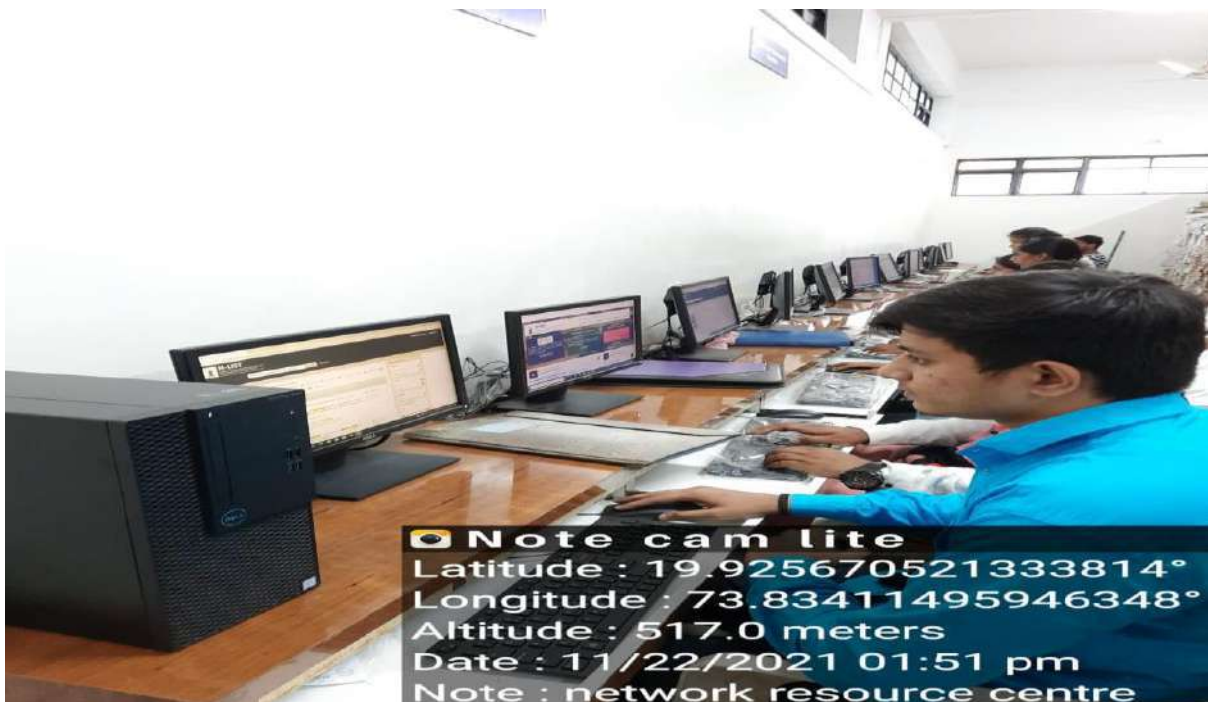
Network Resource Centre